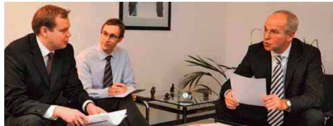
Die Krisensituation stellte auch die Arbeitsrechtler vor neue Herausforderungen.

Das zuletzt durch das Gesetz zur Änderung des nordrhein-westfälischen Arbeitnehmerweiterbildungsgesetzes (AWbG) vom 28.3.2000 novellierte nordrhein-westfälische Arbeitnehmerweiterbildungsgesetz ist infolge eines durch die Kommission der Europäischen Gemeinschaften eingeleiteten Vertragsverletzungsverfahrens erneut geändert worden. Nach Ansicht der Kommission hat die Bundesrepublik Deutschland gegen ihre Verpflichtungen aus Artikel 49 des EG-Vertrages verstoßen. Die EU-Kommission hat insbesondere Anstoß daran genommen, dass Arbeitnehmerweiterbildungsmaßnahmen bislang auf Nordrhein-Westfalen und die an Nordrhein-Westfalen angrenzenden Länder beschränkt waren. Auch das Anerkennungsverfahren und der damit einhergehende Ausschluss ausländischer Anbieter seien mit dem europäischen Recht nicht zu vereinbaren.