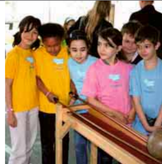
„Düsseldorfer Flurspatzen“ – Kinder der Grundschule Flurstraße in Düsseldorf bei der Jubiläumsfeier zur bundesweit 500. MINIPHÄNOMENTA.

Mit dem Projekt „MINT-Früherziehung“ haben unternehmer nrw ihre Aktivitäten zur frühkindlichen MINT-Förderung landesweit ausgedehnt. Erzieherinnen und Erzieher erhalten praxisorientierte Handreichungen mit Empfehlungen für naturwissenschaftliche Experimente im Kindergartenalltag sowie eine Fortbildung zur Durchführung der Experimente. Bis Ende 2009 haben rund 3.300 Erzieherinnen in NRW an den Fortbildungen zur MINT-Früherziehung teilgenommen.