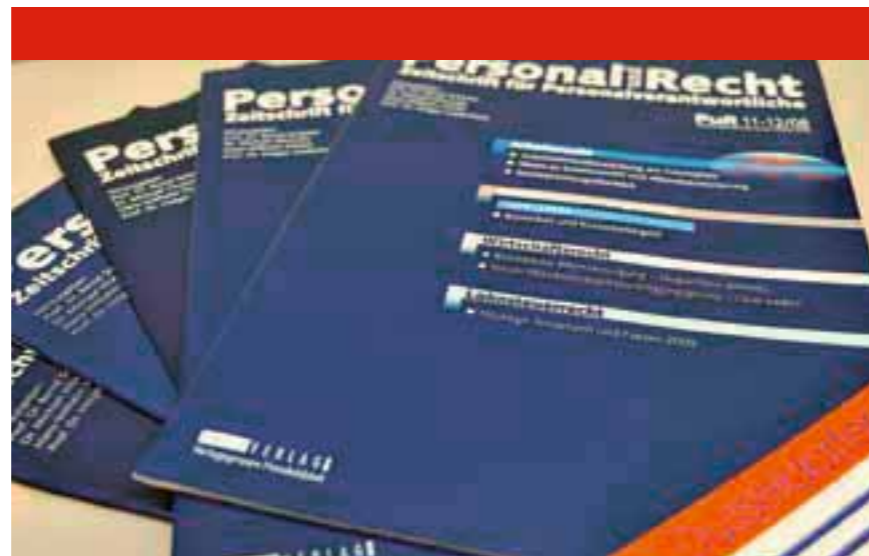
Mit der Arbeitgeberzeitschrift „Personal und Recht“ (PuR) werden die Mitgliedsverbände und -unternehmen stets kompakt und aktuell über die arbeits-, sozialversicherungs- und steuerrechtlichen Änderungen informiert.

Das AWbG steht darüber hinaus künftig allen Anbietern offen, bei denen es sich i. S. d. Neuregelung des § 10 AWbG um anerkannte Einrichtungen der Arbeitnehmerweiterbildung handelt und die über das in § 10 AWbG angesprochene Gütesiegel verfügen. Das bisher in § 9 Abs. 1 AWbG geregelte Verbot der Gewinnerzielung, an dem die Europäische Kommission Anstoß genommen hat, ist entfallen.