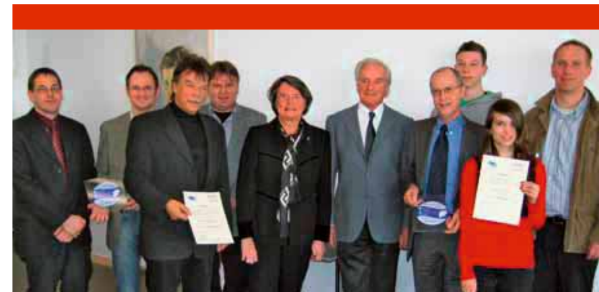
Verleihung der Gütesiegel MINT-REAL durch Christa Thoben, Ministerin für Wirtschaft, Mittelstand und Energie des Landes NRW und Dr. Hans-Jürgen Forst (Bildmitte), Vorstandsmitglied unternehmer nrw.

Im Rahmen des Projektes „MINIPHÄNOMENTA“ werden in Grundschulen Experimentierstationen aufgebaut, die Schüler und Schülerinnen zur selbstständigen Erkundung naturwissenschaftlicher Phänomene einladen. Die Lehrkräfte der Grundschulen werden im Vorfeld der MINIPHÄNOMENTA geschult. Bis Ende 2009 haben rund 270 Grundschulen in NRW die MINIPHÄNOMENTA-Stationen für ihre Schule ausgeliehen. Im Jahr 2010 kommen 120 dazu. Aufgrund der großen Anzahl der Ausleihen in NRW