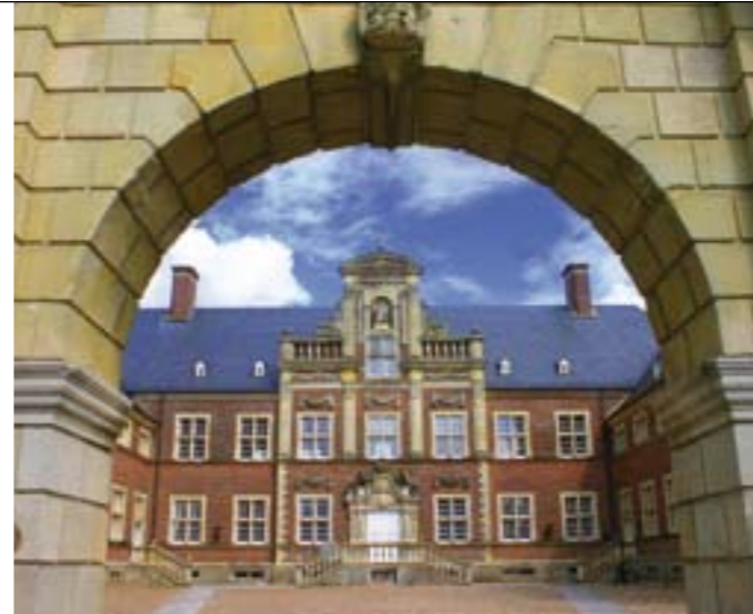
Landesvereinigung der Arbeitgeberverbände Nordrhein-Westfalen e.V.