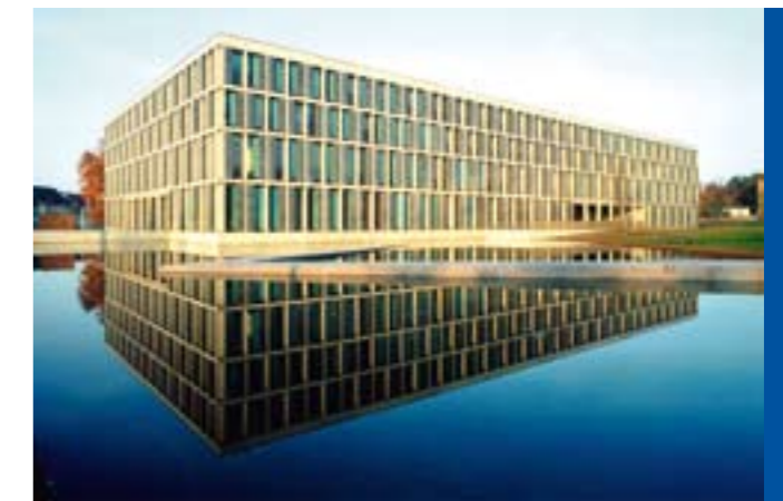
Das Bundesarbeitsgericht (BAG) in Erfurt

Es mehren sich die Zeichen, dass die Bemühungen in der nächsten Legislaturperiode wieder aufgegriffen werden und es gegebenenfalls sehr schnell in die entscheidende Phase geht. Die Arbeitgeberseite muss hierauf vorbereitet sein. Daher beobachtet und begleitet die Landesvereinigung den Prozess.