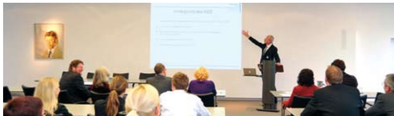
Das Allgemeine Gleichbehandlungsgesetz war Thema zahlreicher Seminare und Vorträge.