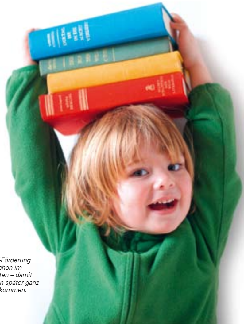
Die MINT-Förderung beginnt schon im Kindergarten – damit die Kleinen später ganz groß rauskommen.

Schulpolitische Reformen der Landesregierung haben seit 2005 die Unterrichtsqualität erheblich verbessert. Möglich machten das vor allem zusätzliche Lehrerstellen, abgesenkter Unterrichtsausfall, mehr Ganztagsangebote, individuelle Förderung als Richtschnur für den Unterricht und der Ausbau der Verantwortung der einzelnen Schule für das eigene Schul-