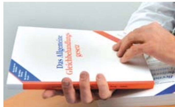
Die arbeits- und sozialrechtliche „Düsseldorfer Schriftenreihe“ der arbeitgeber nrw wendet sich an Betriebspraktiker und ihre Berater. Es sollen jeweils die Grundstrukturen des behandelten Rechtsgebiets sichtbar gemacht werden.

Angesichts der erheblichen Rechtsunsicherheiten ist der Beratungsbedarf gerade im Bereich der Umstrukturierungen erheblich. Die Landesvereinigung verfolgt die Rechtsprechung und berichtet hierüber in Rechtsprechungsübersichten und Vorträgen.