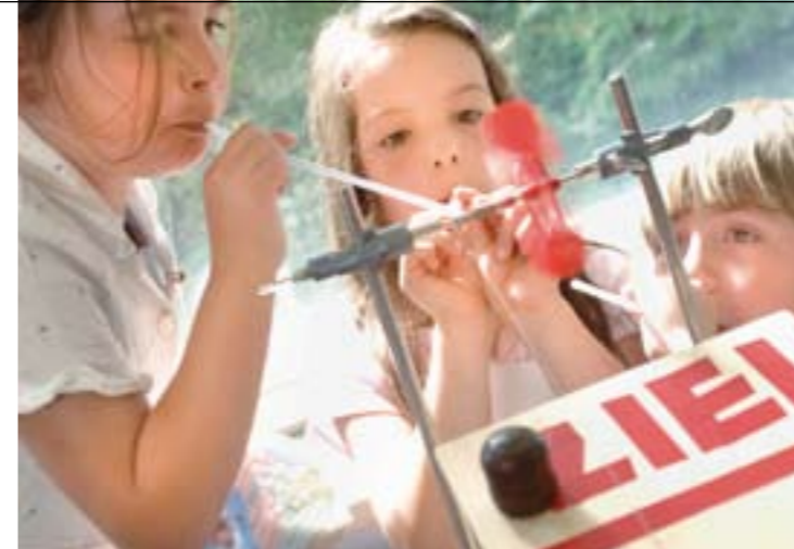
NRW holt auf

geschehen. Von dieser Offensive haben nicht zuletzt die naturwissenschaftlichen Fächer profitiert: Die Kompetenzen der Schülerinnen und Schüler aus Nordrhein-Westfalen sind – nach dem PISA-Schock aus dem Jahr 2000 – mittlerweile OECD-Durchschnitt. Diese Entwicklung haben die Landesvereinigung und ihre Mitgliedsverbände aktiv begleitet.